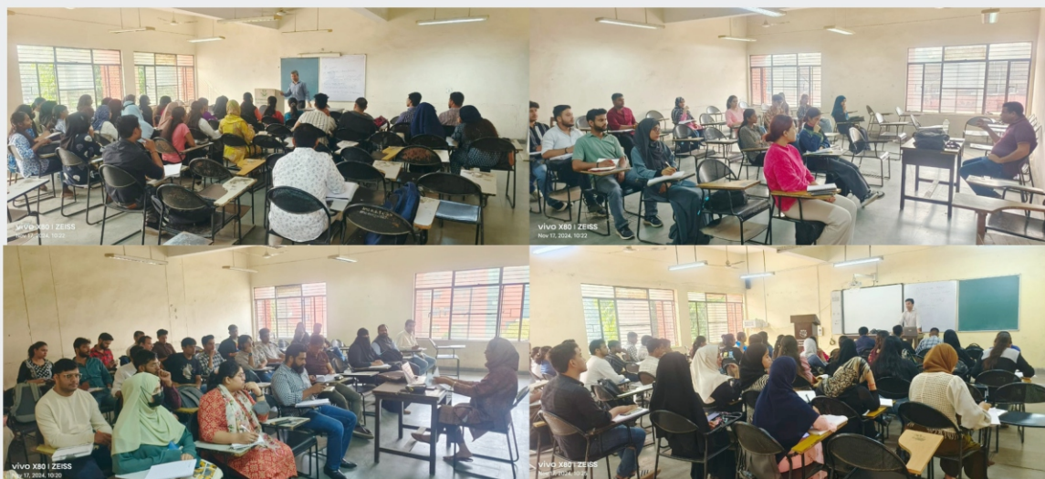
Offline classes were conducted at various leaning support centres (LSCs) of CDOE, JMI