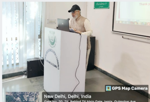
Orientation Program was held for Coordinators of Learning Support Centres (LSCs) on 5th November, 2024 at Conference Room, CDOE, JMI