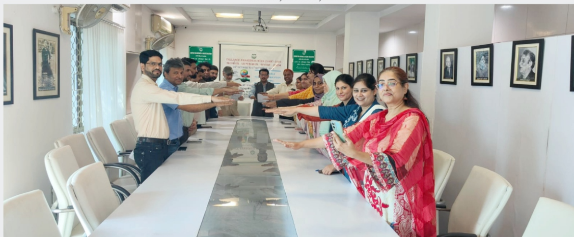
Vigilance Awareness Week was observed during 28th October to 3rd November 2024 at CDOE, JMI